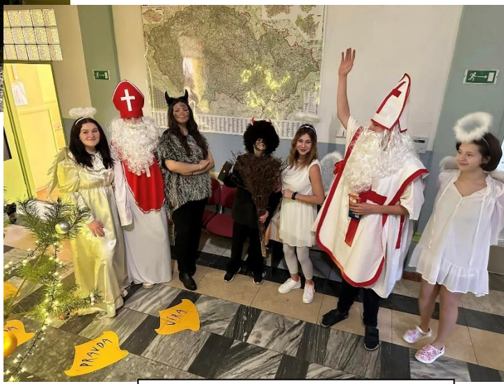
Každý, kdo zlobil, dostane uhlí