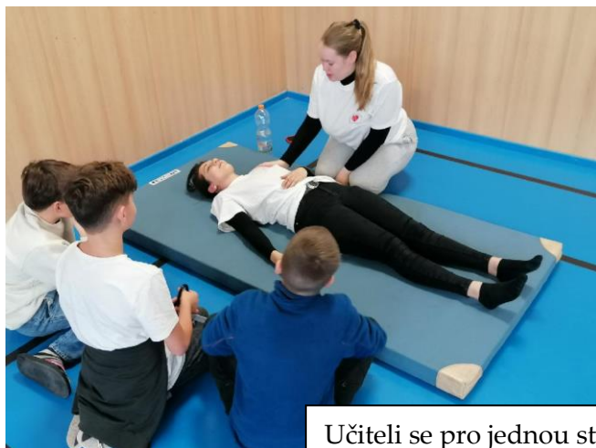
Učiteli se pro jednou stali žáci 2. a 3. ročníku oboru praktická sestra